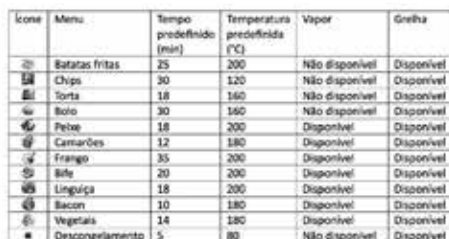
Tabela de programas automáticos